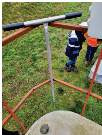
Photos n°6, 7 et 8 : dispositifs de mesure en continu de la qualité des rejets aqueux